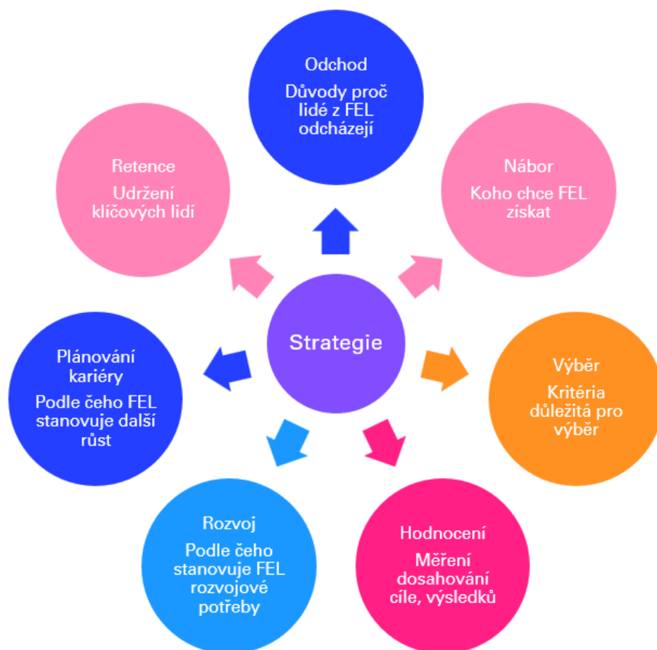
Obrázek č. 1 Kompetenční model

Na základě schématu je patrné, co všechno by mělo být realizováno při cíleném rozvíjení lidských zdrojů v organizace, a to pro všechny typy pozic.